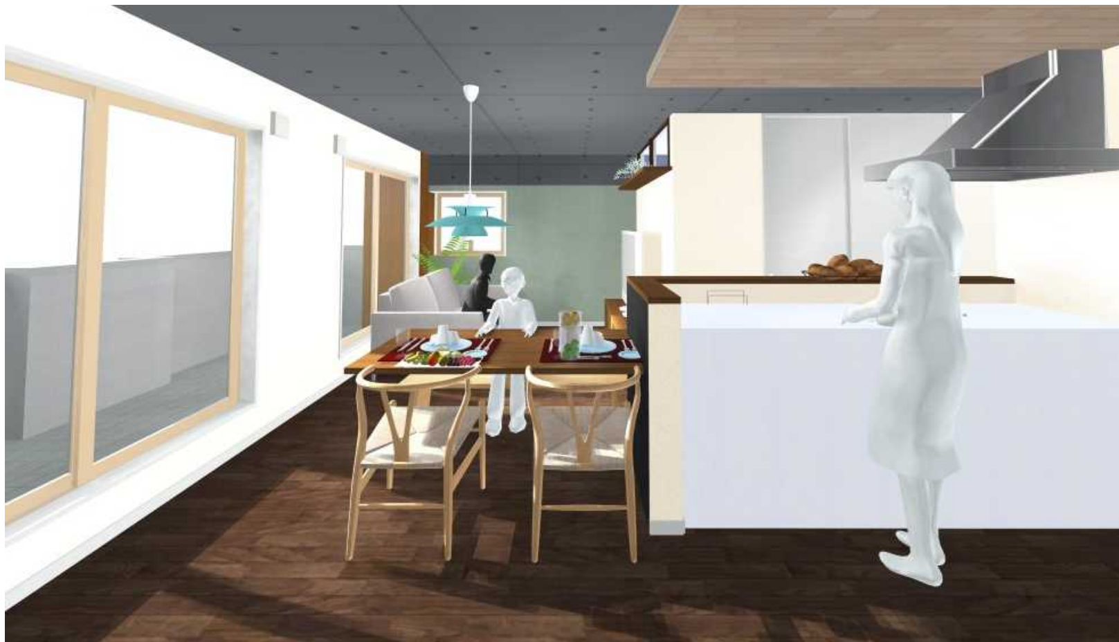
LDK イメージパース キッチンが生活の中心に配置し家族間のコミュニケーションを大切に考えました。