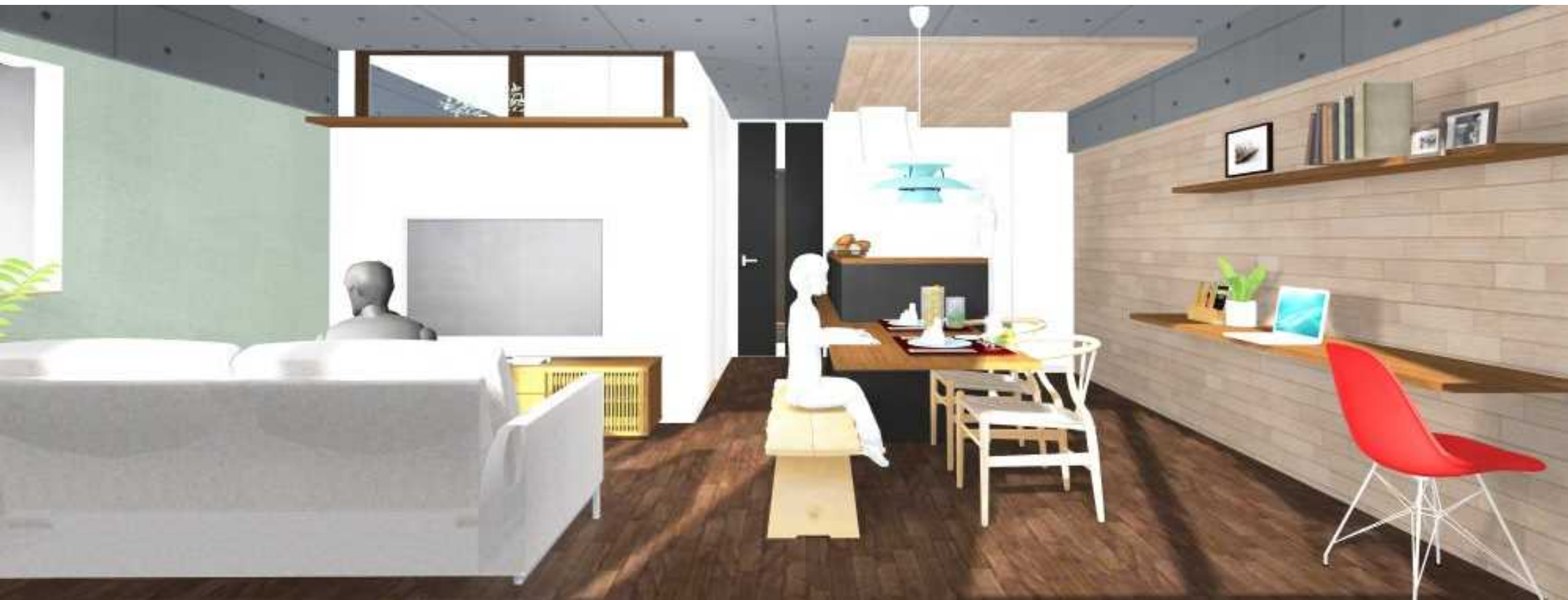
LDK イメージパース 家族のコミュニケーションがはずむ開放的なアイランドキッチンプラン