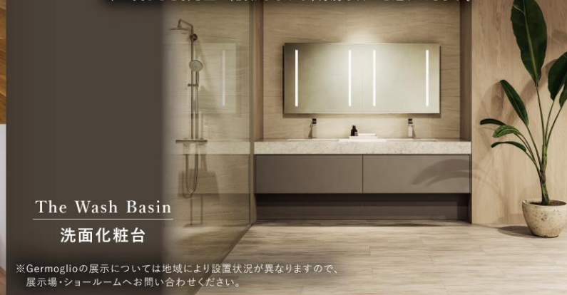
The Wash Basin 洗面化粧台

住友林業オリジナルキッチン&洗面化粧台。木の美しさを引き立て、調和しながら、特別な日々を連れてきます。