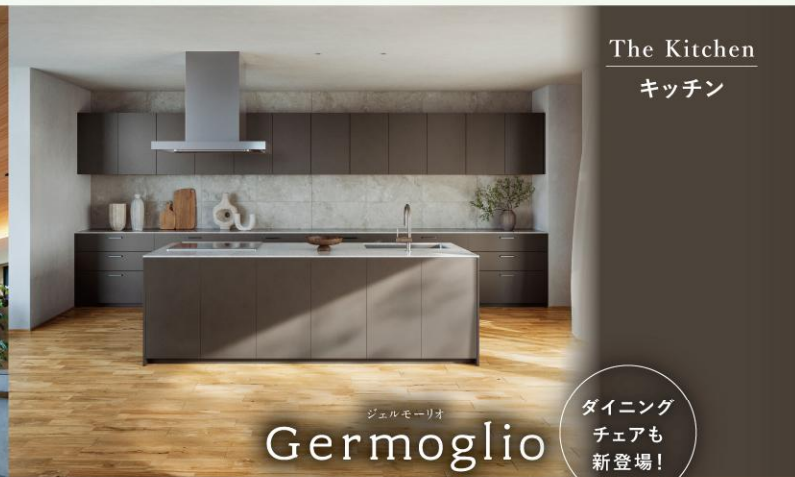
The Kitchen キッチン