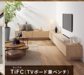
ティフカ TiFC(TVボード兼ベンチ)