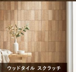
ウッドタイル スクラッチ