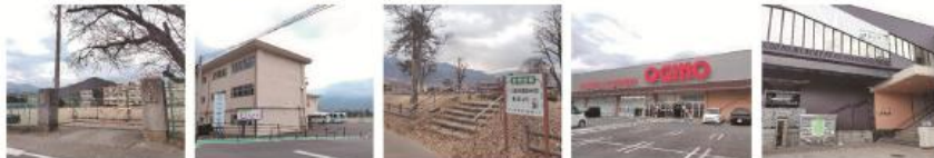
甲州市立塩山南小学校 徒歩約14~15分 (約1,100~1,130m) 甲州市立塩山中学校 徒歩約11~12分 (約870~900m) 鈴音公園 徒歩約12分 (約930~960m) オキノ甲州店 徒歩約9分 (約650~680m) JR中央本線「塩山」駅 徒歩約17分 (約1,300~1,330m)

※記載の前線は地盤上に基に算出した概算距離です。※徒歩分数は1分/80mで計算しております。距離は概り上げてあります。 【物件概要】●所在地/山梨県甲州市塩山下於第734号1の一部、2、6の1。7●交通/JR中央本線「塩山」駅北約1,200m、山梨交通バス「下於西」停徒歩約9分(約660~690m)●地区画数/3区画●今回販売区画数/3区画●用途地域/無指定●地目/畑(造成完了後、宅地に変更予定)●造成工事完了予定日/2026年5月10日●建ぺい率/70%●容積率/200%●道路/西側:公道幅員7.1~7.2m(1号地)、北側:私道幅員4.5m(1・2号地)、南側:私道幅員4.5m(3号地)、アスファルト舗装●私道負担/有(41,999円)●上水道/公営上水道●下水道/公共下水道●電気/東京電力●ガス/プロパンガス●水道負担金/88,000円(13mm)、検査手数料10,000円●その他重要事項/通行地役権が設定されています。●取引条件の有効期間/2026年6月30日