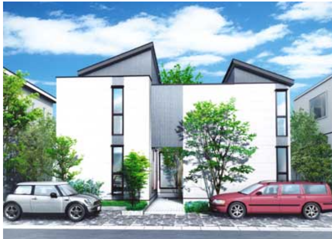
＜イノスの家「DayLight next (デイトライトネクスト)」 ”住まいの中心に光のポーチがある家”外観＞