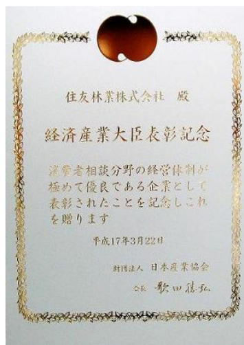
経済産業省大臣表彰記念 表彰状