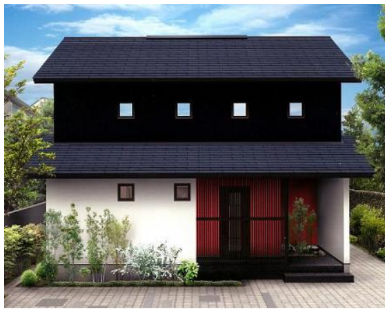
<イノスの家「連(れん)」外観>