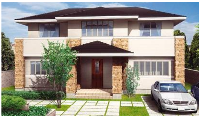
<無垢造デザインの「イノスの家」外観イメージ>