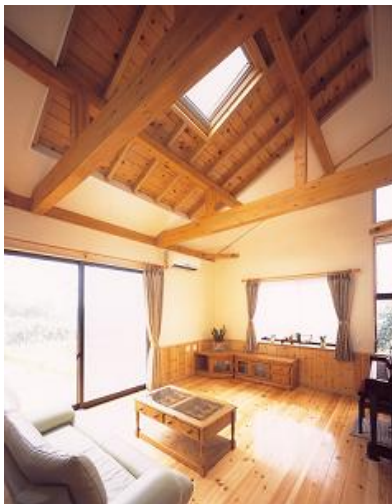
<無垢造デザインの「イノスの家」室内イメージ>