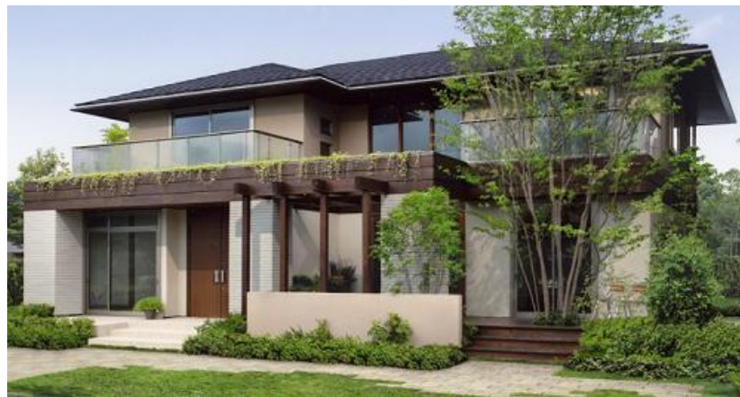
<MyForest (マイフォレスト) 外観イメージ>

外装には付柱、付梁、面格子などに国産杉を採用し、自然の風合いを伝え、日本の街並にしっかりとけ込みつつも、印象深い木質感あふれる外観デザインを提案します。木と塗壁、深い軒、面格子など、どこか懐かしく、それでいて本物の木の重厚感、上質感、木の持つ豊かな表情を建物外観に演出します。住むほどに愛着の深まる家、「MyForest(マイフォレスト)」は住友林業が提唱する新しい日本の木の家です。