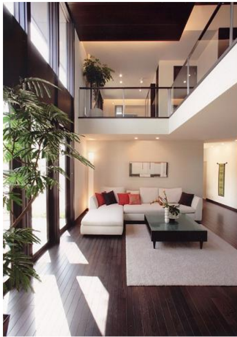
<MyForest（マイフォレスト）室内イメージ>