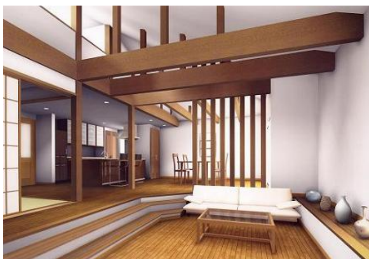
イノスの家「楽人（らくと）」 “グラウンドレベル リビング”イメージ