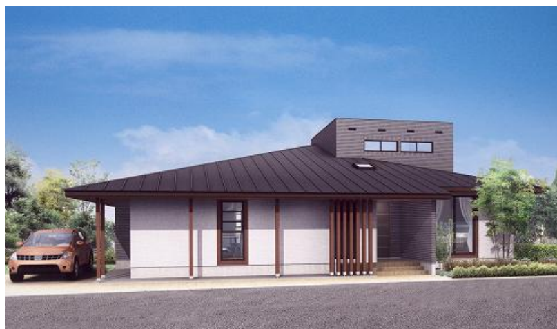
イノスの家「楽人（らくと）」外観イメージ