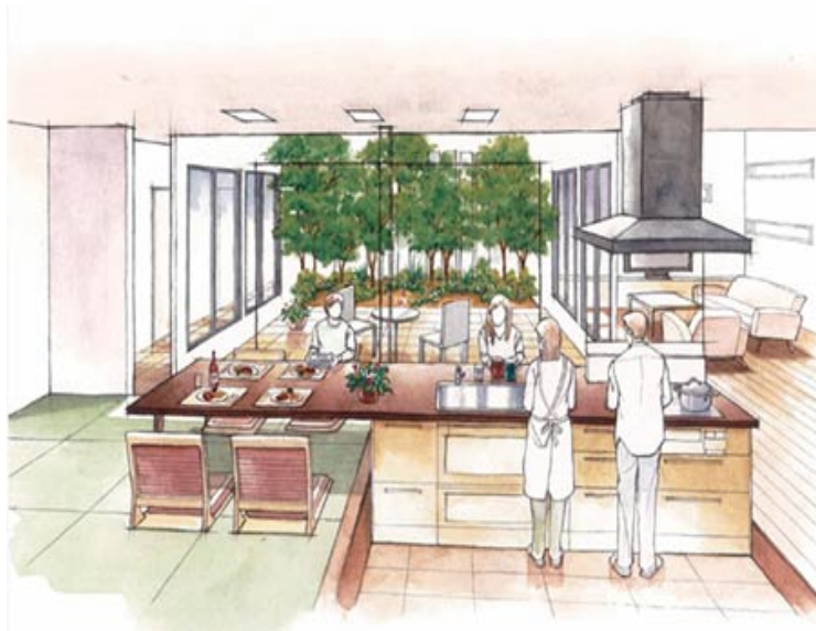
<イノスの家「LOVING KITCHENのある家」>