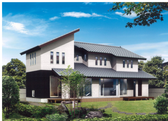
イノスの家「和三景」 スタイリッシュ和風の「来景」外観イメージ