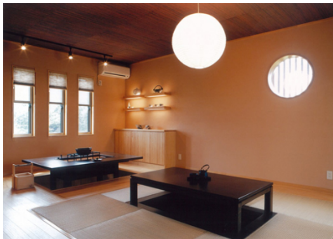
イノスの家「和三景」 モダン和風のリビング室内イメージ