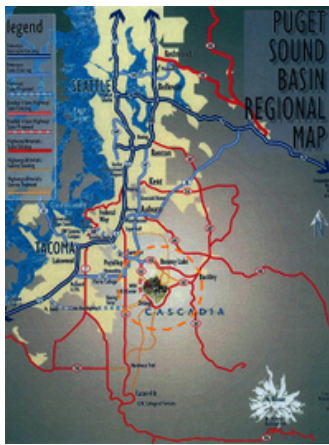
Cascadiaプロジェクト位置関係