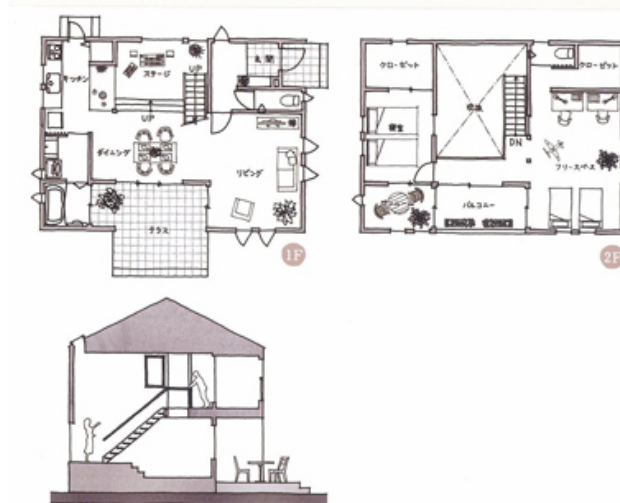
イノスの家「co.co.to(ココト)」 センターステージのある家 プランイメージ