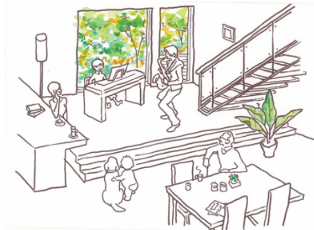
イノスの家「co.co.to(ココト)」 センターステージのある家 室内イメージ