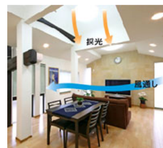
吹き抜けや引き戸を取り入れたリフォーム実例

リビングやキッチンなど、生活の中心空間を広々とさせ、吹抜けや引き戸に変える提案などで、明るく風通しのいい快適な暮らしに。断熱材の充填や、省エネ効果の高い窓・玄関ドアなど提案も盛り込みます。