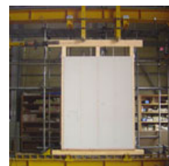
ショート高タフパネル実験