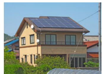
太陽光発電システムを搭載したリフォーム事例

太陽光発電（太陽の力で電気をつくる）、インナーサッシ（もう1枚サッシを取り付けることで断熱性・遮音性をアップ）、真空ペアガラス（ガラスを取り替えることで断熱性アップ）、節水キッチンなど。