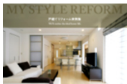
戸建てリフォーム実例集