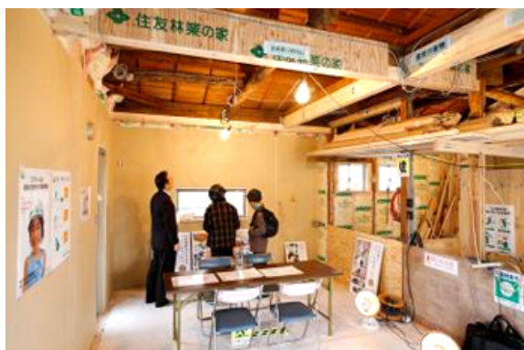
耐震補強や断熱性向上を確認できる築30年の戸建て住宅の構造現場（東京都）