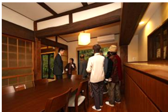
新旧の良さを活かした築100年を超える旧家リフォーム完成現場（奈良県）