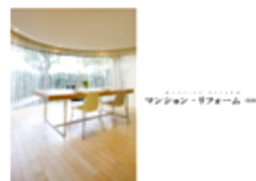
マンションリフォーム実例集