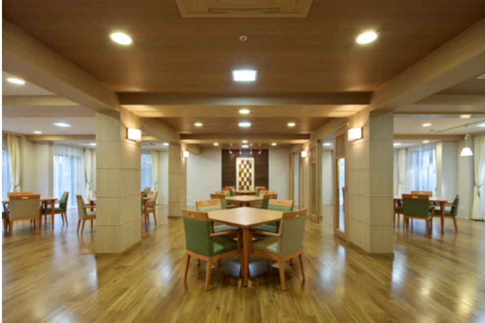
国産の木材をふんだんに活用し、木のあたたかみに包まれたダイニングルーム。

なお、本施設は今年4月に新設した「木化推進室」が設計・施工に携わった初の物件となります。山林事業から木材の製材・加工・流通事業、木造住宅の建築販売、木質バイオマス発電に至るまで、木に関するあらゆる事業を展開する当社グループの使命として、木化推進室では今後の拡大が期待される非住宅分野での木造化と内装等の木質化において、国産材を軸とした新たな基準・規格づくりを推進し、木材資源の新たな用途拡大を目指しております。