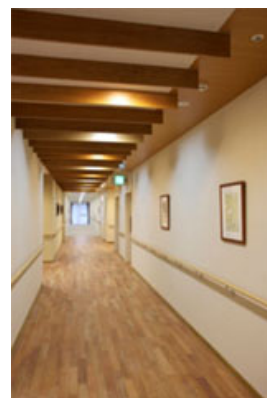
国産ヤマザクラを床材に、国産杉のルーバーを天井のアクセントに用いたエントランスホール。

新しい木質部材、木構造を開発することは、国産材の利用方法や使い方を広く「見える化」することにつながります。それにより、商業施設や文教施設などの新たな場所で広く活用される環境づくりに貢献できると考えております。