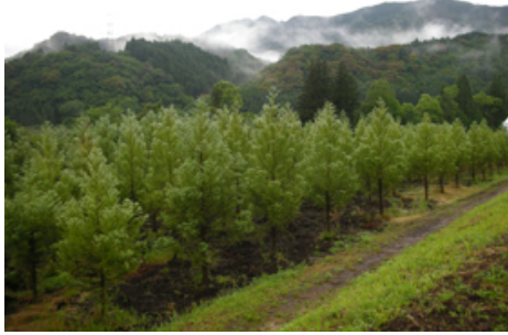
採穂園の様子。各台木はDNA分析によりクローン管理されている。