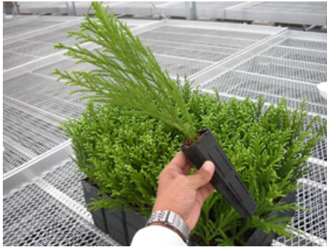
育苗用培土に挿し付けしたコンテナ苗木。専用トレイにセットし、ベンチに載せて育苗する。育苗段階に合わせて、苗木の間隔を変えることが可能。