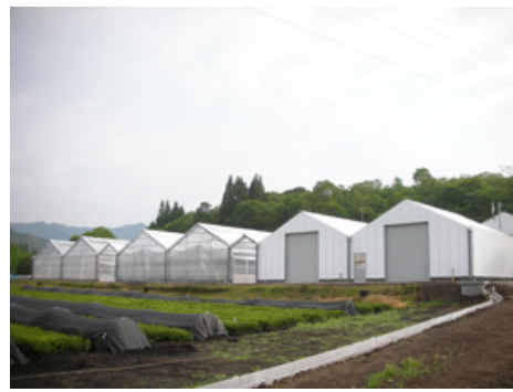
右から挿し付けなどの作業を行う「作業棟」、加温設備ありの「温室」、加温設備なしの「温室」（2つで1棟）。