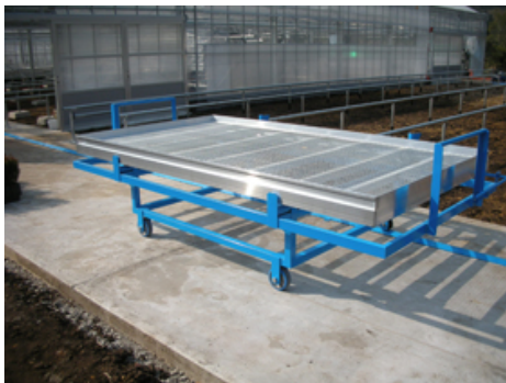
「ムービングベンチ方式」におけるベンチを移動するためのカート。これに載せて温室間や屋外の順化場所に一人でも移動が可能。加温設備ありの温室～加温設備なしの温室～屋外順化場所という流れの3か所でそれぞれ一定期間育苗し、計12か月で出荷が可能となる。