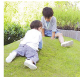
わくわくマウンド