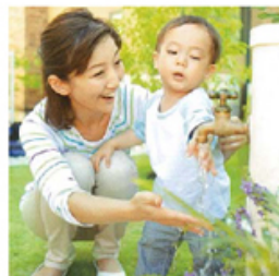
じゃぶじゃぶシンク