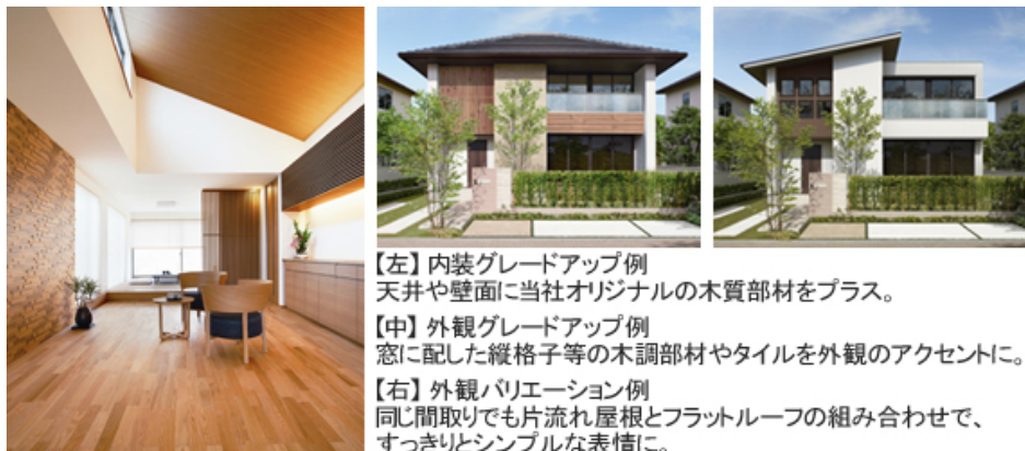
【左】内装グレードアップ例 天井や壁面に当社オリジナルの木質部材をプラス。

また、屋根形状の違いや独自の外装部材により、一つのプランから多様な外観バリエーション提案を可能とし、お客様一人ひとりの外観に対する要望にも柔軟に対応します。