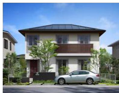
「My Select BF-Si」外観イメージ

インターネットを活用することで、営業効率や設計効率の向上を図り、販売コストの削減による低価格化の実現や、比較的スピーディな家づくりを希望されるお客様に対応できることも大きな特徴の一つです。