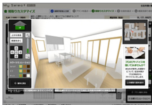
3D内観画面（部屋を歩く）

インターネットを活用することで、営業効率や設計効率の向上を図り、販売コストの削減による低価格化の実現や、比較的スピーディな家づくりを希望されるお客様に対応できることも大きな特徴の一つです。