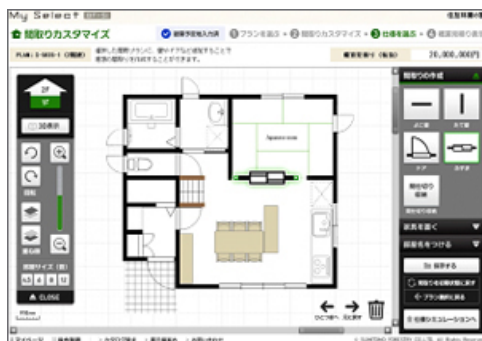
間取りカスタマイズ画面