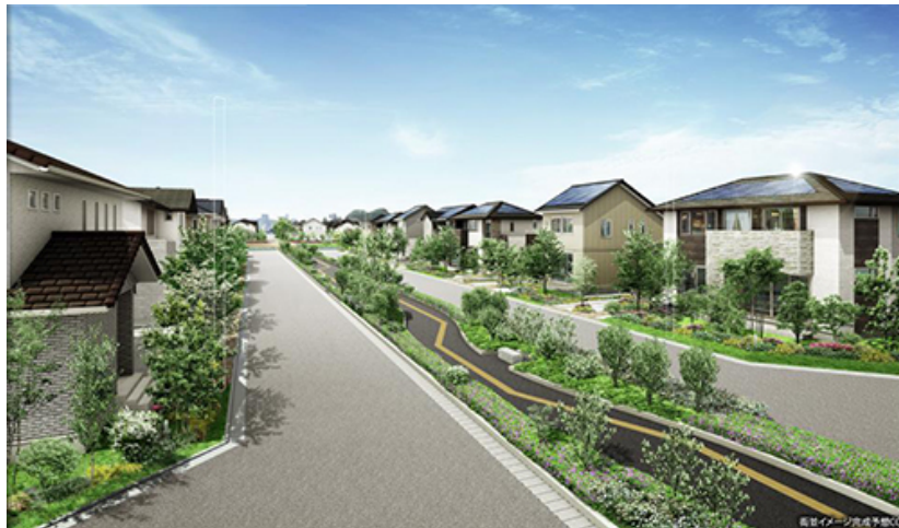
「さきまち荒井南サスティーナタウン」モデル街区

「さきまち荒井南サスティーナタウン」は仙台市東部の防災集団移転地域にあり、本年12月に予定されている地下鉄東西線の開通を契機に、仙台復興のシンボルとして今後の街づくりが注目されているエリアに立地しています。全区画を竹中工務店グループの株式会社竹中土木が造成工事を実施し、ハウスメーカー3社がそれぞれ先進の技術を導入、スマートハウスを中心とした次世代型住宅を提供しています。電力の見える化や見守りサービスなど自然エネルギーを賢く利用して、暮らしの快適性の持続を目指したサスティナブルスマートタウンとなっています。