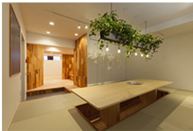
オーナーズラウンジ