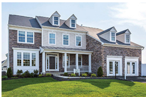
DRBグループ 戸建住宅 外観イメージ