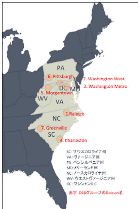
DRBグループ 事業エリアMAP 米国東海岸6州を中心に展開