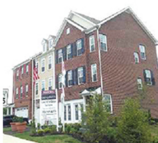
タウンハウス※ 外観イメージ