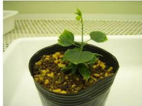
写真4 一般の土壌で育成中の苗木