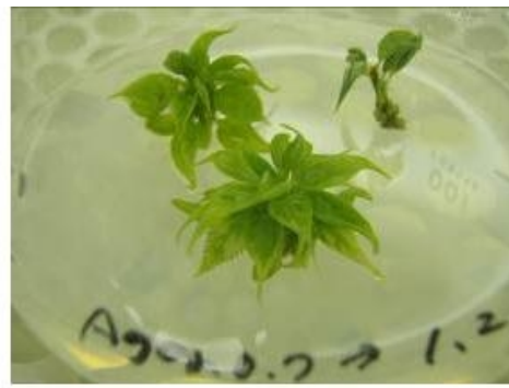
写真2 多芽体からの芽の伸長 (培養6ヶ月目)