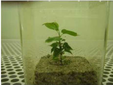
写真3 人工土壌で発根した幼苗 (培養8ヶ月目)