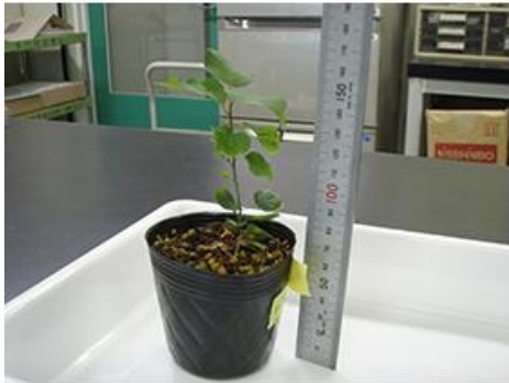
写真5 温室内で育成した苗木