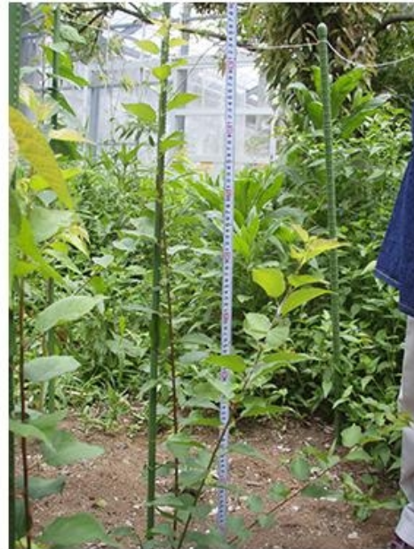
写真6 畑で育成中の苗木