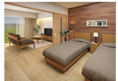
ドマーニ神戸 内観イメージ(E3タイプ)

スミリンケアライフ(旧:神鋼ケアライフ)が1995年に開設した介護付有料老人ホーム。総戸数258戸で、自立している方から要支援・要介護状態の方まで幅広く入居を受け入れます。医療機関との連携を背景とした高度で質の高いサービスにより「終のすみか」としてご入居者、ご家族をはじめ外部から高い評価を得ています。リノベーションしたモデルルームは主に自立している方が入居されるD2タイプ(1LDK・49.40㎡)とE3タイプ(2LDK・56.70㎡)の2室で、E3タイプは2人居住用を想定しています。