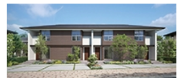
フォレストメゾン 外観イメージ

今回の共同開発は、住友林業の研究施設である筑波研究所での、実棟に即した実験でLL値35、LH値50(参考資料を参照)を達成。創業以来「木」を軸に事業を展開してきた住友林業の木の知見と木造住宅のノウハウ、熊本城への制振ダンパー納入実績のある住友ゴムの長年のタイヤ材料研究の知見、住宅建材の開発に携わり続けているマックストンのモルタル成形技術を生かし、連携した成果です。