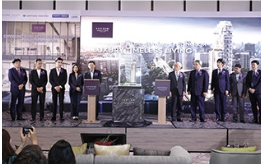
販売開始の記者会見の様子