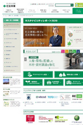
住友林業グループサステナビリティレポート2020(ウェブ版)