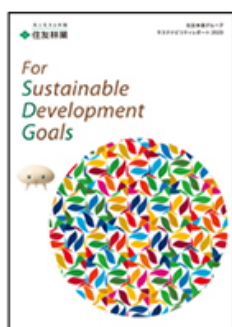
住友林業グループ サステナビリティ活動ハイライト2020