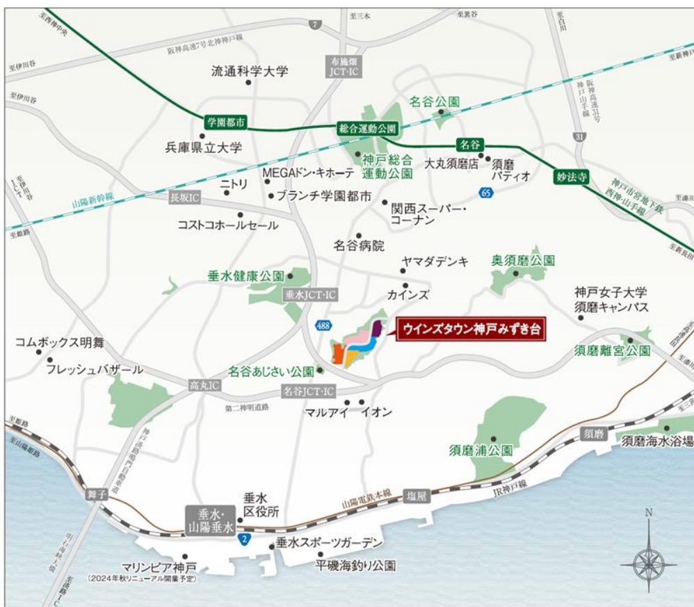
【所在地】兵庫県神戸市垂水区みずき台