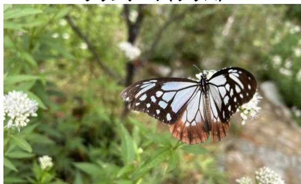
“フジバカマ”にとまる“アサギマダラ”