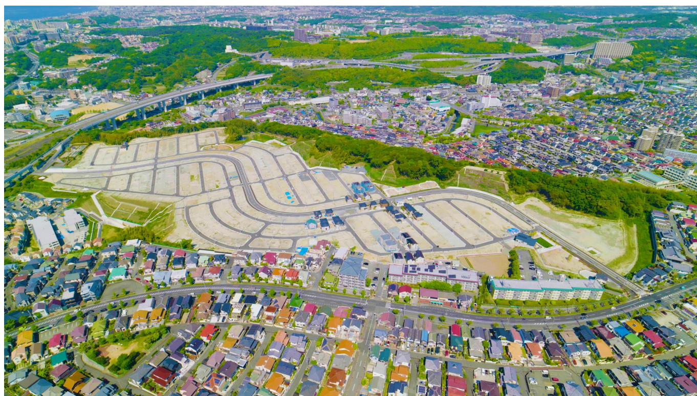
『ウインズタウン神戸みずき台』現地空撮

パナソニック ホームズ株式会社およびトヨタホーム株式会社、トヨタホーム近畿株式会社、ミサワホーム近畿株式会社、住友林業株式会社、セキスイハイム近畿株式会社が共同で販売企画を進めてきた兵庫県神戸市垂水区の大型分譲地『ウインズタウン神戸みずき台』(全589区画)は、このたび、2024年5月23日(木)にまちびらきし、全事業会社の第一期分譲がスタートします。