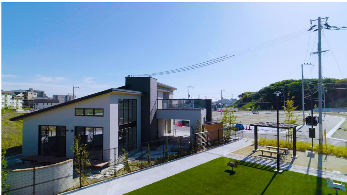
『ウインズタウン神戸みずき台』コミュニティコテージ外観