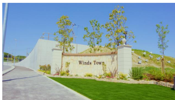
タウンゲート(サウス)

今後、各住戸の外構には、“アサギマダラ”が好むとされる“フジバカマ”の花を植えることを推奨するなど、自然豊かな環境の中、街ぐるみで生物多様性を実現する取り組みも予定しています。