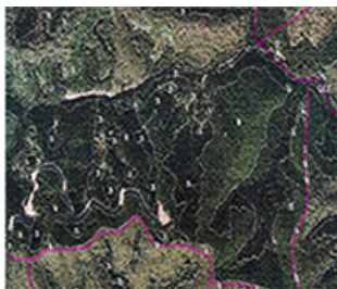
<図2:新規の林分情報>