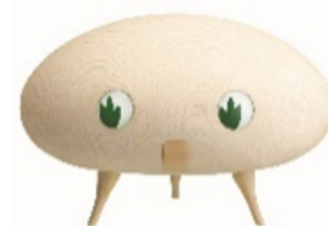
住友林業グループのオリジナルキャラクター 「きこりん」