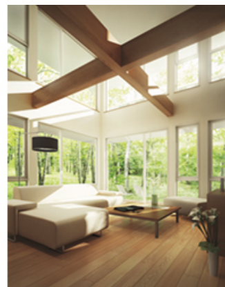
<建物内観イメージ>