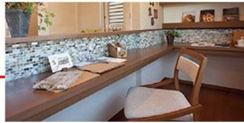
ヨガなどを行える多目的スペースには、 読書やパソコン作業ができるスペースも用意。

女性は住まいにおいてキッチンなどの設備を重視する傾向がみられます。そのこだわりに応えるためキッチンをはじめ、照明、飾り棚、室内物干など選択可能なアイテムを8種類用意。キッチンについては高さや幅、収納の量、天板の材質から扉カラーまでカスタマイズできます。