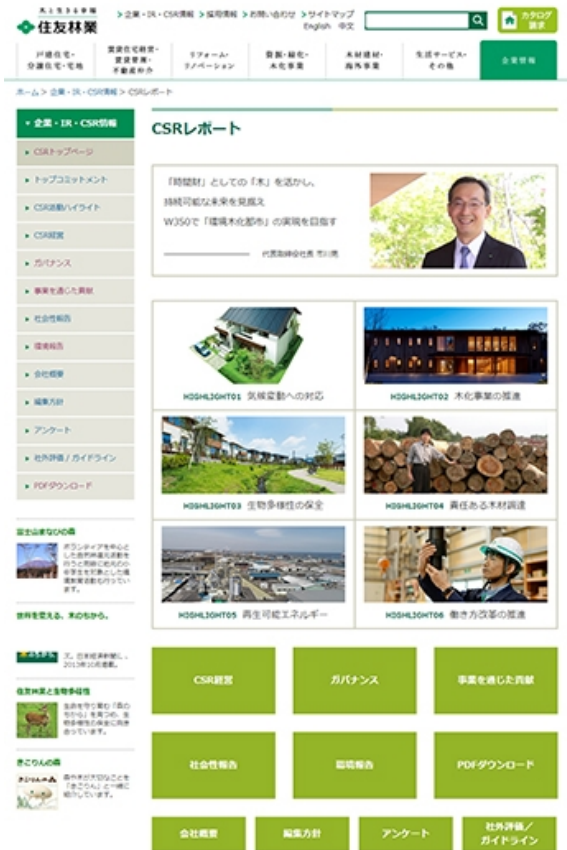
CSRレポートウェブページ