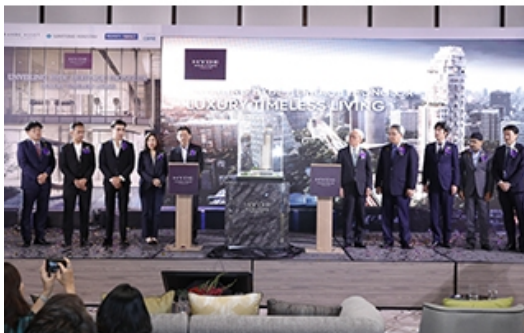
販売開始の記者会見の様子