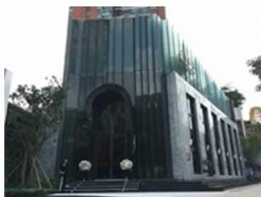
セールスギャラリー外観

地上3階建て、1ベッドルーム2部屋(43.2㎡/50.7㎡)、2ベッドルーム1部屋(77.5㎡)のモデルルームがご覧いただけます。