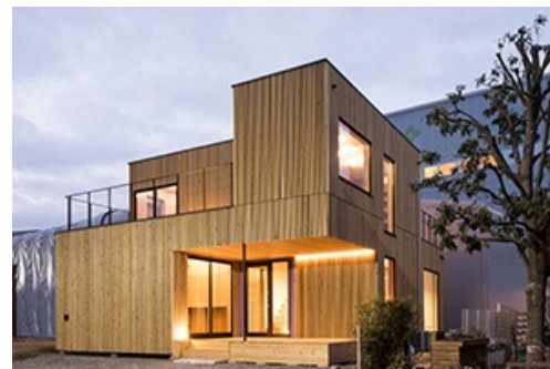
CLT combo外観(筑波研究所内で撮影)

基本設 NUSSMÜLLER ARCHITEKTEN ZT 計 GMBH 実施設 (株)梶浦暁建築設計事務所 計 施工 住友林業ホームエンジニアリング (株) 竣工 2019年9月