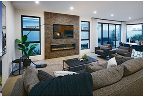
<101 Residential >