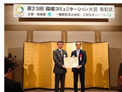
2020年2月19日に行われた表彰式の様子

今回の受賞で主催者から「様々な対象向けに充実した報告書を発行しておりアカウンタビリティに努めている。事業活動の様々なステージにおける生物多様性に関する活動が開示されており、バリューチェーン全体を通じて生物多様性に真剣に取り組んでいることが理解できる。TCFDシナリオ分析やSBTの取組など企業の中でのトップランナーである。保証対象情報の対象項目が多い点や対象範囲が明確になっている」と評価されました。