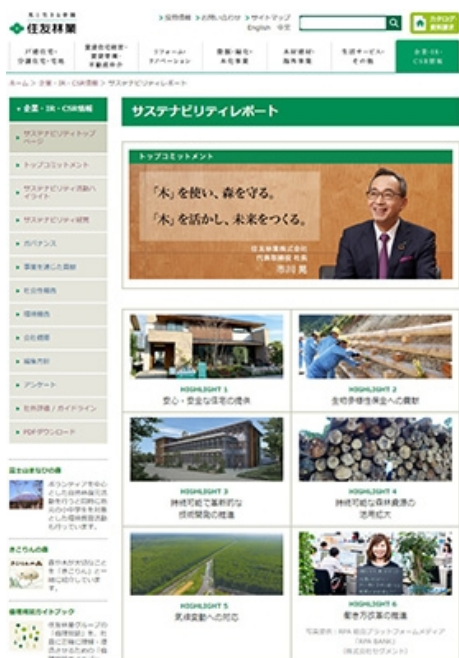
住友林業グループサステナビリティレポート2019(ウェブページ)