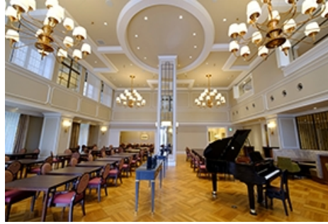
吹き抜けの「ダイニングルーム」