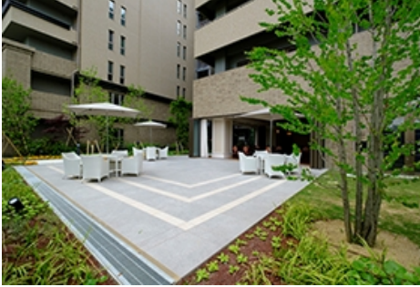
車いすの方でも気軽に緑を楽しめる「屋外テラス」 暮らしやすさを追求した一般居室(モデルルーム)