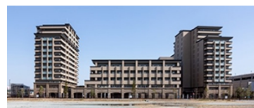
エレガーノ西宮 外観

本施設は、住友林業が培ってきた住まいや木と緑の効用に関する知見を活かしつつ、20年以上にわたる介護ノウハウに、充実した検診体制や多彩なプログラム等、健康寿命向上につながるサービスを追加しました。進化した「Elegano(エレガーノ)」ブランドとして高齢者の住まいを提供します。