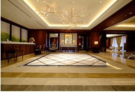
おもてなしの「エントランスホール」