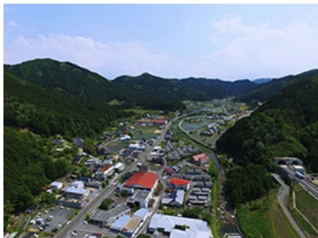
西栗倉村の森林遠景