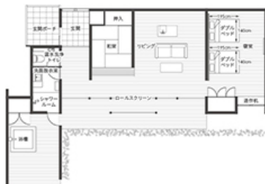
ヴィラ平面図(イメージ)