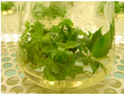
写真3 多芽体からの芽の伸長