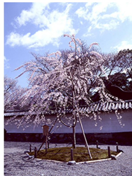
醍醐寺の境内にある「太閤千代しだれ」

住友林業は「太閤しだれ桜」の樹勢回復と後継樹増殖に取り組み、2000年組織培養による苗木増殖に成功しました。増殖した苗木は2004年11月に総本山醍醐寺境内に移植し、翌年4月に無事開花しました。「太閤千代しだれ」と名づけられたこの桜は親木と並んで毎年花を付け訪れる方を楽しませていきます。