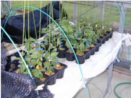
写真5 屋外での順化