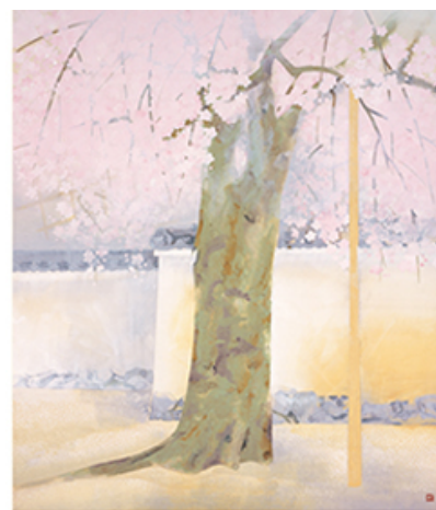
奥村土牛 《醍醐》 1972(昭和47)年 紙本・彩色 山種美術館

東京に生まれる。本名義三 よしぞう 。梶田半古 はんこ に入門、兄弟子 こけい ・小林古径の指導も受ける。1927(昭和2)年、院展に初入選、1932(昭和7)年に同人となる。1947(昭和22)年、帝国芸術院会員。1962(昭和37)年、文化勲章を受章。1978(昭和53)年、日本美術院理事長。遅咲きの画家として知られ、薄い絵具を何重にも塗り重ね、淡い色調によるおおらかで温かみのある作風を確立した。