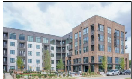
NOVEL LoSo Station

クレセント社がテネシー州ナッシュビルで開発した集合住宅「NOVEL West Nashville」が Best Community Amenities 部門で、ノースカロライナ州シャーロットで開発した集合住宅「NOVEL LoSo Station」が Best Overall Leasing or Sales Campaign(Multifamily Community)部門で選出されました。