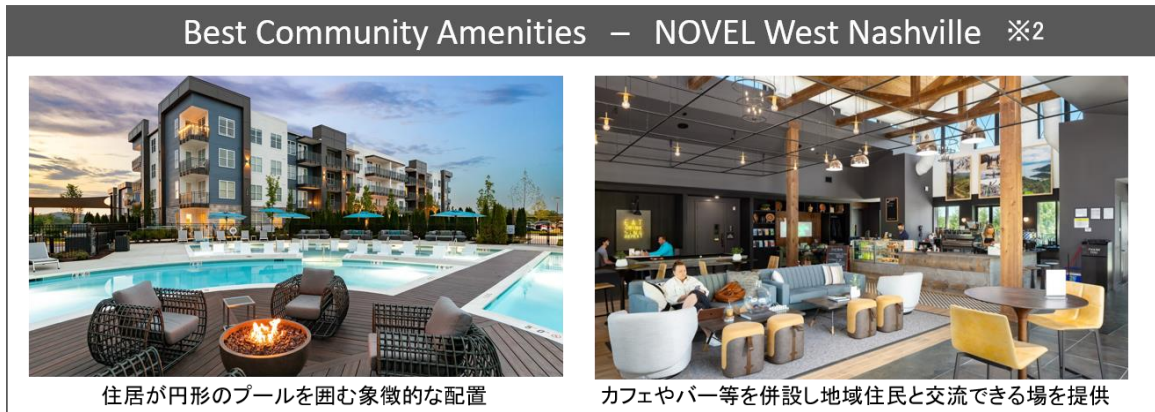
住居が円形のプールを囲む象徴的な配置