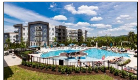
NOVEL West Nashville

※1 1942年の創設以来80年の歴史があり140,000超の加入者を擁する米国最大の住宅建設業界団体。