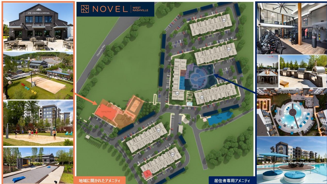
地域に開かれたアメニティ

同物件はコーヒー豆に拘ったお洒落なカフェや地域のスポーツリーグが開催されるビーチバレーコート等、数多くの充実したアメニティを有しています。一般的な米国の集合住宅ではアメニティの利用は居住者に限られますが、同物件では地域の住民へも開放し、住民間の交流を促すことで地域のコミュニティ形成に貢献しています。地域全体へより良い住環境を提供するユニークなアイデアが Best Community Amenities の受賞に繋がりました。