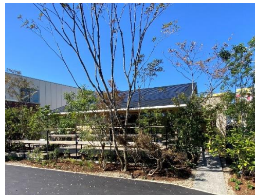
四季を感じる外構設計