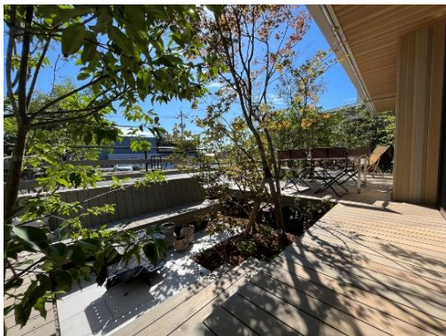
室内外をつなぐウッドデッキ

※6 YouTube「住友林業の家」 https://www.youtube.com/c/sfc_ie