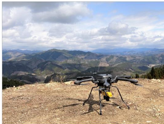
ドローン撮影の様子

岡山県真庭市（市長：太田 昇 以下、真庭市）、西日本電信電話株式会社 岡山支店（支店長：西川 智洋 以下、NTT 西日本岡山支店）、株式会社地域創生 Co デザイン研究所（代表取締役所長：木上 秀則 以下、地域創生 Co デザイン研究所）、および住友林業株式会社（社長：光吉 敏郎 以下、住友林業）は、持続可能な森林経営に向けて真庭市の森林情報をデジタル化し CO 2 吸収量を「見える化」する共同実証を実施しました。森林の価値を適切に評価し、質の高いカーボンクレジットを創出することで森林価値向上をめざします。