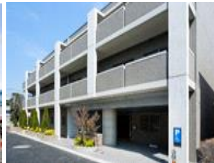
グランフォレスト目白