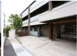
グランフォレスト神戸御影