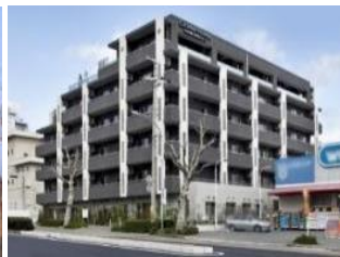
グランフォレスト神戸六甲