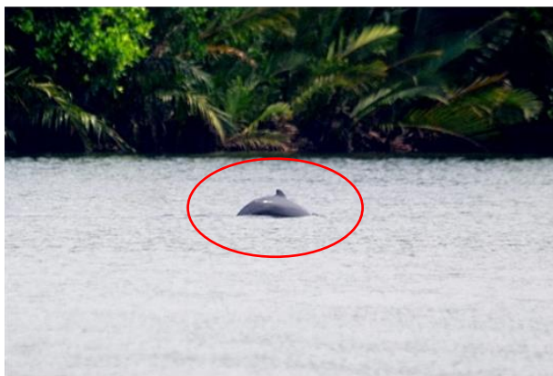
付近で生息が確認された絶滅危惧種のカワゴンドウ( Orcaella brevirostris )