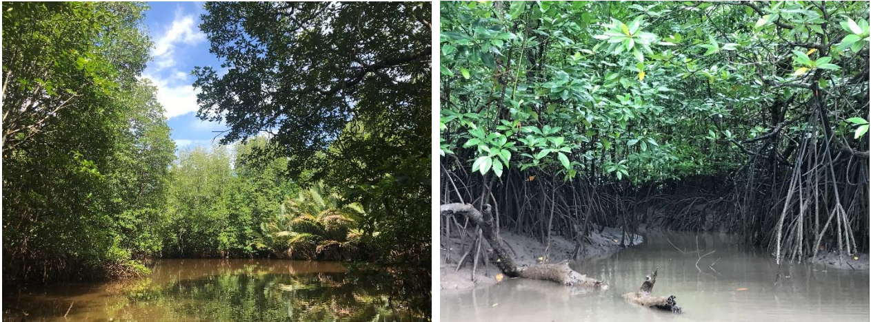
保有・管理するマングローブ