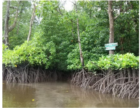
保有・管理するマングローブ(地上で撮影)

※5 Global Forest Resources Assessment (FRA) FAO 2020 年