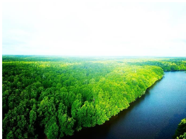
保有・管理するマングローブ(上空から撮影)

※4 自然環境と地域住民、企業活動をより広い範囲でとらえて生態系を保全する考え方