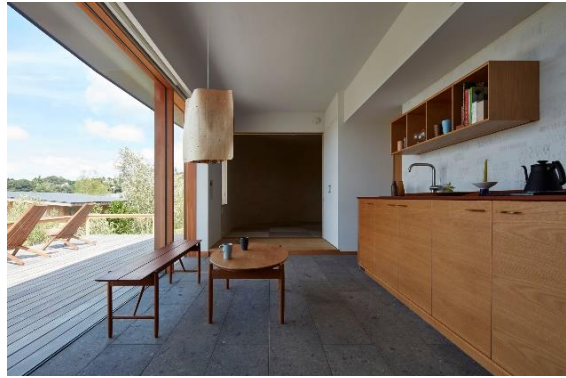
室内外をフラットにつなぐ開口部