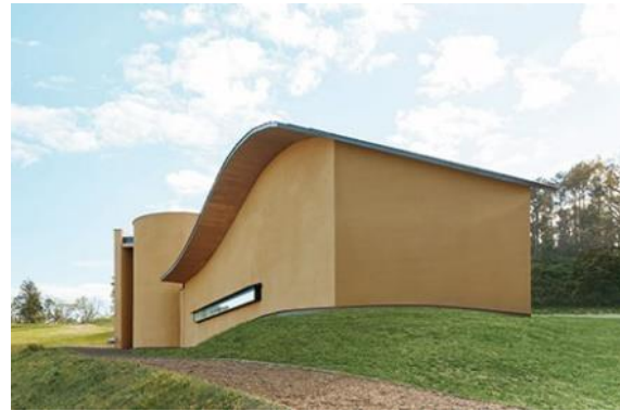
シフォンケーキ製造・販売店舗