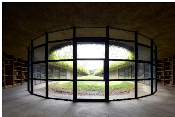
シンメトリーに曲線を描くエントランス