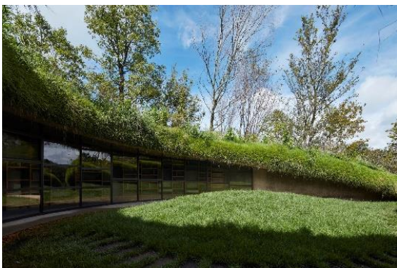
地中にひっそりと存在する佇まい

中腹に位置する「地中図書館」はその名の通り洞窟のように地中に横たわっています。大地の中に潜り込んで本を読み、知識を蓄え、想像する力を養い、再び大地を踏みしめて未来へと進んでいく人々の支えとなる場をコンセプトに設計されました。最深部の読み聞かせホールは開閉式のトップライトを用いて、室内に自然光を取り込みます。室内の柱や梁などの建築的な要素を無くして「地中」を表現。地形を優先して施工した不規則な天井高も特長です。