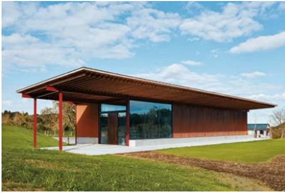
シャルキュトリー