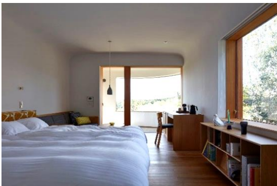
壁と天井のつながりは曲面でシームレスに施工

高台に位置する「cocoon」(コクーン)は繭 まゆ の形をしたヴィラタイプの宿泊施設です。計7棟の客室とキッチンラウンジ、レストラン、サウナの小屋が点在し、宿泊する人をゆるやかにつなぐ設計です。環境、農業、生き物たちに触れ、命のつながりを感じることで、暮らしを考えるきっかけや意識の変化につながる場をコンセプトに設計されました。外装材には奈良県吉野郡吉野町の「吉野杉」を使用。無垢材は素材そのものの自然な経年変化を生み出します。ほかにも木質の内装材や家具、屋上緑化など、宿泊を通じて「木」の温もりをふんだんに感じられる施設です。