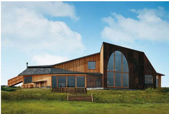
ダイニング・ベーカリー