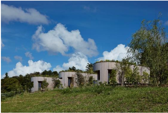
アール加工を施した外壁が印象的な外観