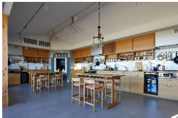
宿泊者が料理を楽しめるキッチンラウンジ