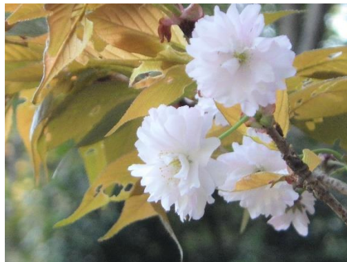
日吉桜、開花の様子

日吉桜は八重の山桜の一種で、一輪に30枚ほどの淡紅色の花びらをつけます。社伝には平安末期から鎌倉時代の歌人として知られる西行法師が参詣の折に「一重づづ 七の社に手向けてもなお余りある 八重桜かな」という歌を詠んだとの言い伝えが残り、東本宮に縁の深い ※1 ご神木として古くから親しまれてきました。