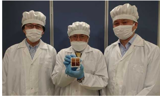
図4 京都大学と住友林業にて宇宙曝露試験体を受理 (クリーンルーム内にて)

住友林業は試験体の今後の詳細分析を通じて、ナノレベルの物質劣化の根本的なメカニズムを解明することを目指します。このメカニズムを解明することで、高耐久木質外装材等の高機能木質建材や木材の新用途開発に役立てていきます。