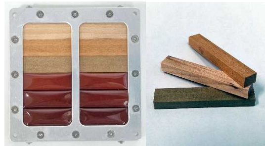
図1 宇宙曝露した木材試験体

※3 LignoSat(リグノサット)は、Ligno(木)と人工衛星(Satellite)からなる造語で本プロジェクトにて命名。